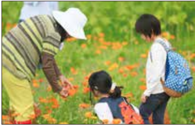
自然農園で心をきれいに して花摘みをする

A: ホメオパシーの基礎、哲学、および現代医学の解剖・生理・薬学、ホメオパシー病理のエッセンスを学び、その上で、セルフケアの考え方、マテリアメデイカ、実践ケースなどを