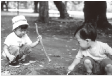
好奇心旺盛な子どもたち

発展に関する事業を行い、国民の健康生活に貢献することを目的とし、二〇〇八年十二月一日に設立され、活動を開