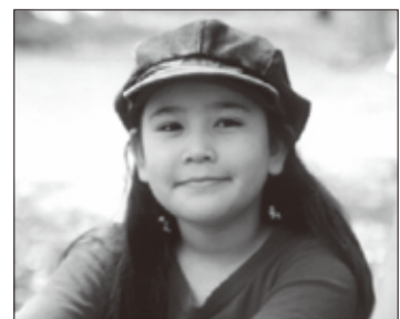
力強い意志を持つ子ども

③有資格者の自覚を持つことで、健康についての関心が高まり、ホメオパシーや、各種代替療法なども含めた、ホメオパシー統合医療に関する学習意欲が向上します。